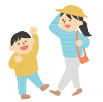
※写真・イラストはイメージです。